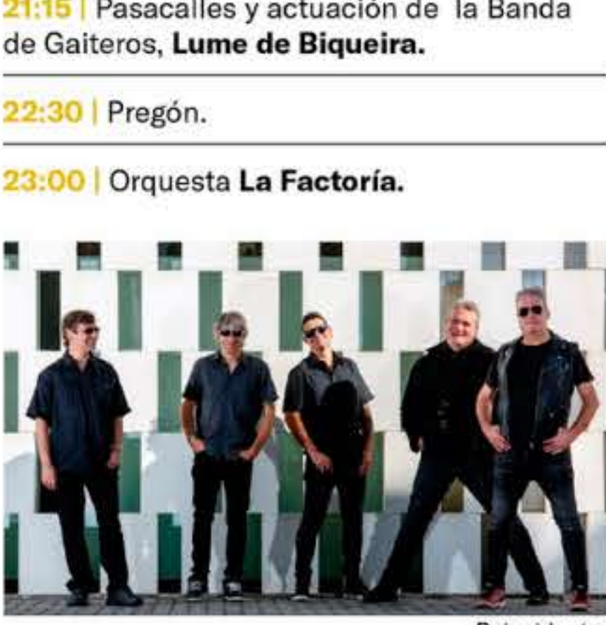
Lume de Biqueira

21:15 | Pasacalles y actuación de la Banda de Gaiteros, Lume de Biqueira .