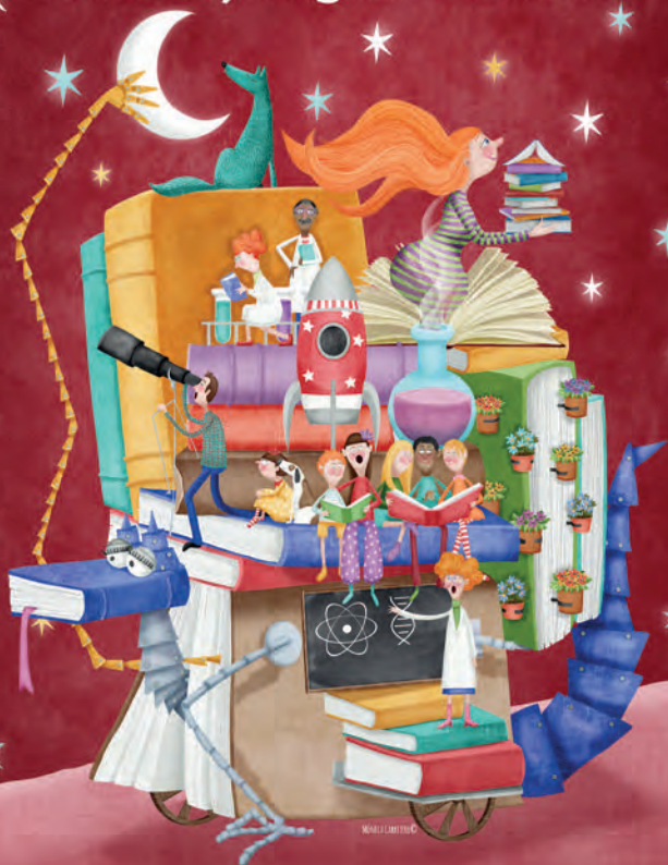
Ilustración: © Mónica Carretero

En el Parque de la Fuente. Del 26 de mayo al 3 de junio.