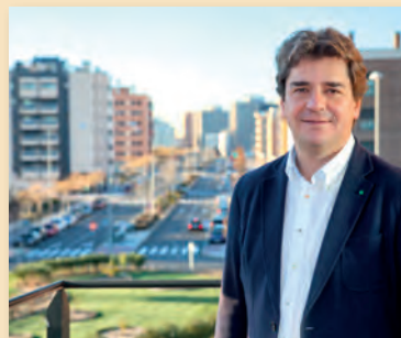
Javier Ayala Alcalde de Fuenlabrada

La Feria del Libro de Fuenlabrada llega a su 33ª edición. A lo largo de todos estos años, la lectura ha sido una compañera de viaje con la que los fuenlabreños y fuenlabreñas de todas las edades, y especialmente los más jóvenes, han ido haciendo camino al andar, un camino liberador, enriquecedor y gozoso, que nos ha ayudado a despertar nuestra mirada para conocer el mundo que nos rodea y viajar hacia el interior de nosotros mismos.