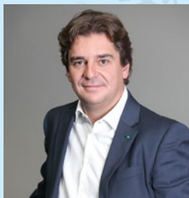
Javier Ayala Alcalde de Fuenlabrada